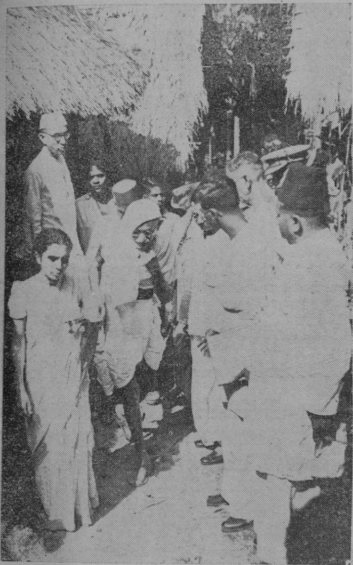
La fotografía recoge un momento de la visita de inspección de Gandhi, acompañado por Sushila Nayar, por zonas de Noshkhar, devastada durante los recientes disturbios en la India.