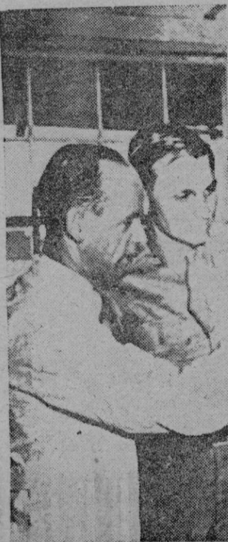
Un centenar de científicos alemanes, ayudados por tres mil obreros especializados, trabajan en Nueva Méjico (E.E. U.U.) en la construcción y comprobación de las V-2 que se están fabricando bajo la dirección del técnico Werner Von Braun. La fotografía capta un aspecto de la sala de comprobaciones, con el aparato desde el que se sigue y dirige la trayectoria de vuelo de la nueva arma.