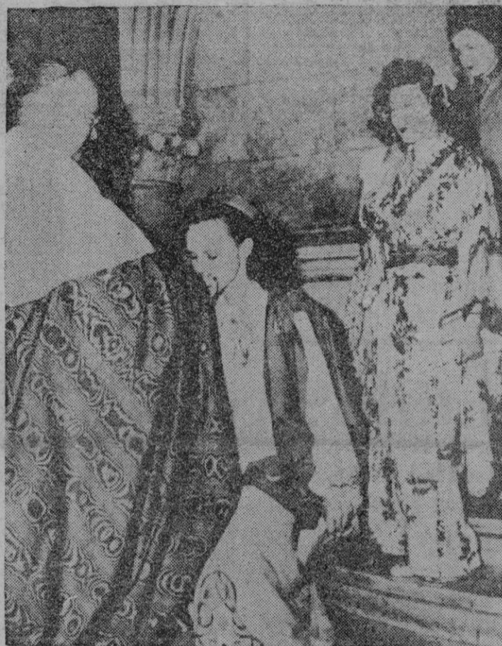
Los alumnos del colegio católico de Manhattanville, de Nueva York han asistido a una solemne Misa, en el curso de la cual se han recogido donativos a beneficio de los huérfanos de la guerra. Los estudiantes —simbolizando el espíritu de hermandad espiritual entre las razas y las naciones— vestían trajes típicos de sus respectivos países. En la fotografía, aparece el arzobispo de Nueva York, monseñor Spellmann, cuyo anillo episcopal besan los alumnos