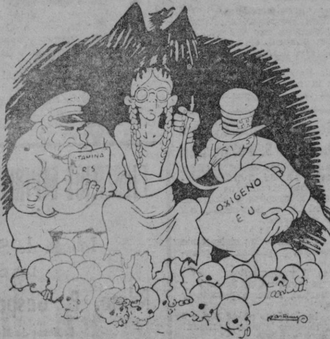
— ¡Qué raro! Ahora resulta que todos me idolatran.