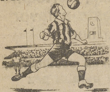
avanza con el balón y su esbelto tal al viento.