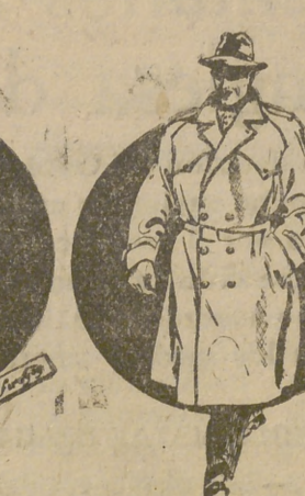
Trinchera torna sol, color moda, 730 pts. (Cruzada)