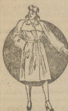
Trinchera señora canerú 499 pesetas. Trinchera jovencita, 375