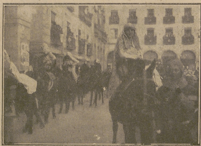
Cabalgata en el Mercado Grande