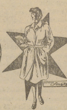
Trinchera señora, lisa, 465 pesetas