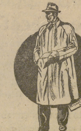
Gabardinas, 595 pts. Id. Tornasol, 850 pesetas