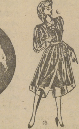
Transparente Cristal, 275 pts.