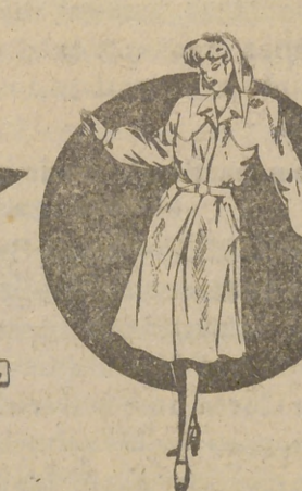
Trinchera señora, Modelo París, 675 pesetas