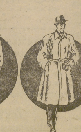
Trinchera lisa gris verdoso, 550 ptas. (Color moda)