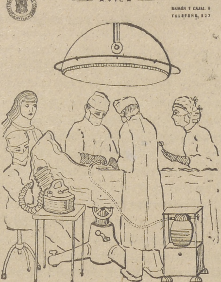
UNA BUENA ASISTENCIA EN UN MODERNO SANATORIO

DIRECCION: DR. TEJERINA Habitaciones individuales para operados y acompañantes.—Departamento de operaciones.—Sala de operaciones sépticas.—Transfusión sanguínea.—Oxigenoterapia y carbonoterapia.—Onda corta.—Rayos X, fijo y portátil.—Laboratorio. Publicidad «AVILA».