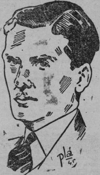
SIR ANTONY EDEN

Gobierno para la actual sesión parlamentaria. Eden recordó su declaración de julio de 1941, como miembro del Gabinete de guerra, de que no forma parte de la política británica originar el derrumbamiento económico de ninguna potencia y de que la miseria y la bancarrota de Alemania, en medio de Europa, «venenarán» a todos sus vecinos entre ellos a Inglaterra; afirmando a continuación que aquellas palabras deben seguir siendo, a su juicio, la base de la política del Reino Unido. «Ha llegado el momento de enfrentarse con el hecho de que no podamos cumplir las obligaciones derivadas de un instrumento internacional si los demás no hacen otro tanto.»