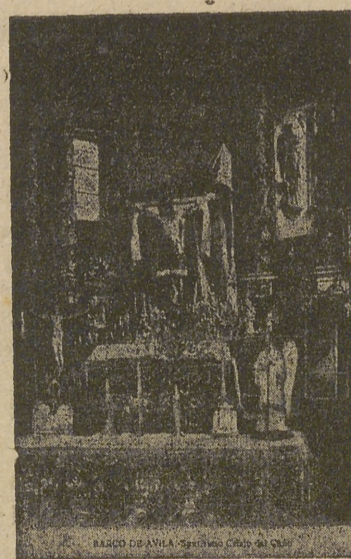
STMO. CRISTO DEL CAÑO

—Sea nuestra vida perpetua acción de gracias; sea El bendito y alabado por los siglos de los siglos.