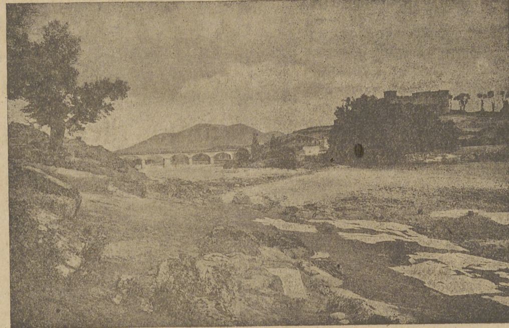
CASTILLO DE VALDECORNEJA Y RIO TORMES

A las once y media.—Certamen Catequístico en la parroquia. Co-