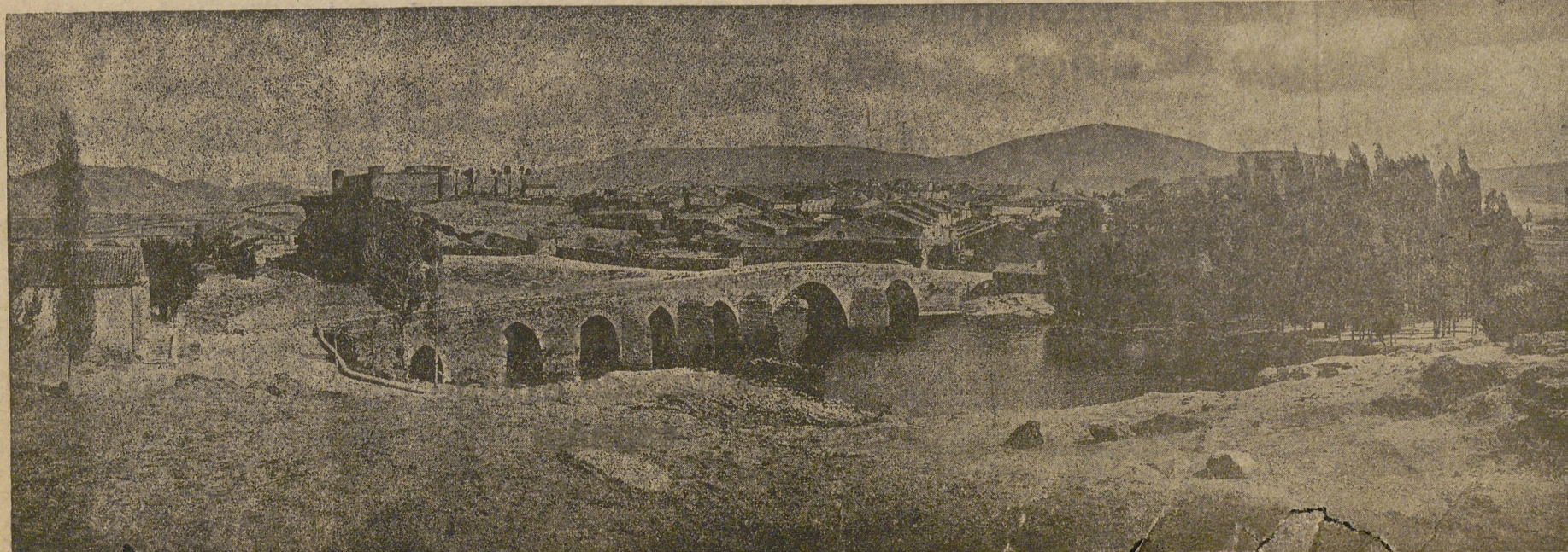
VISTA GENERAL DE BARCO DE AVILA

Día 23 Dedicado a Barco de Avila, a su región y demás pueblos que concurren Al amanecer.—Toque del Ángel