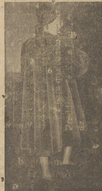
Abrigo «raglan» de piel con nuevo modelo de mangas, todo él en piel de castor