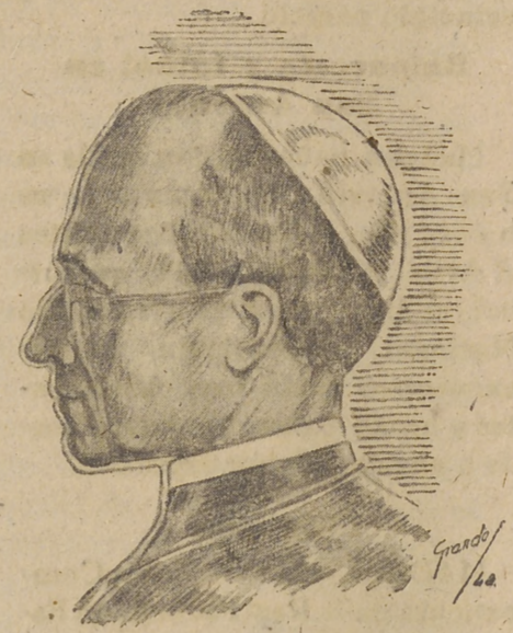
~ S.S. PÍO XII ~

«Su Santidad ocasión fiesta Sacerdotal Día del Seminario complacese otorgar nuevos presbíteros, superiores, seminaristas, blahcheros, implorada Bendición Apostólica prenda celestiales gracias ese Centro.—Montini, sustituto.»