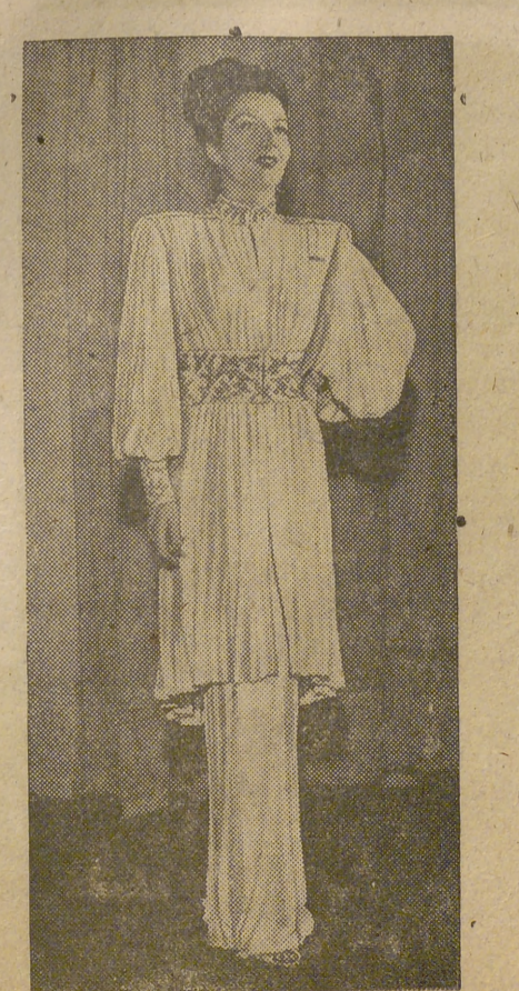
Modelo para recepción confeccionado con jersey blanco.