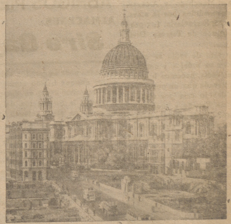
Perspectiva de la catedral de San Pablo en Londres

El miembro del Comité central comunista Carlo Pagetta salió al patio de la Prefectura y dijo a los quinientos ex combatientes que se marcharan a sus casas. Los hombres, muertos de frío, comenzaron a vitorear la decisión. Pagetta dijo que los obreros italianos deben unirse en la lucha contra el partido cristiano demócrata apoyado por los Estados Unidos.—EFE.