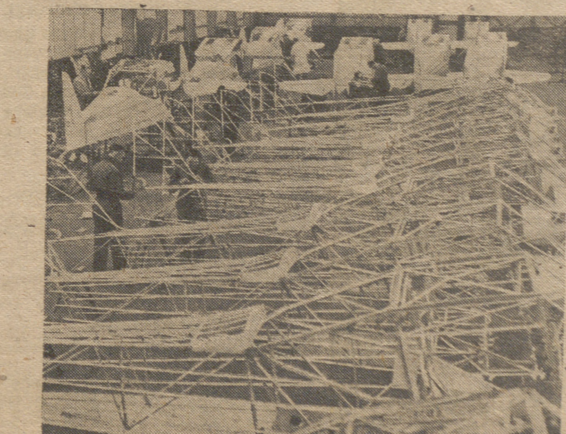
Los fabricantes británicos de aviones ligeros siguen a la cabeza con sus productos; un ejemplo notable son los tipos construidos por la Auster Aircraft Co. Estos no necesitan campos de aterrizaje especiales. En la fotografía: Taller de montaje con «Autocrias» de 100 hp. y tres plazas en diferentes estados de construcción.

A propuesta de la Dirección General de Trabajo, el ministro de este departamento ha acordado modificar las normas de sueldos de la dependencia mercantil elevando, a partir del primero de julio, el 20 por ciento de los sueldos base de las categorías profesionales fijadas en las vigentes normas de Comercio de 25 de abril de 1945.