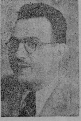
El Presidente de la Federación Balear de Fútbol