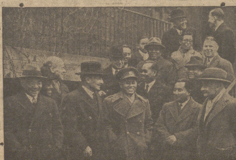
Los delegados de Birmania llegan a Londres. Conversan con Ailee en la puerta de la residencia del primer ministro británico

ría en El Pradillo, siguiendo por la noche en las inmediaciones de la barriada.