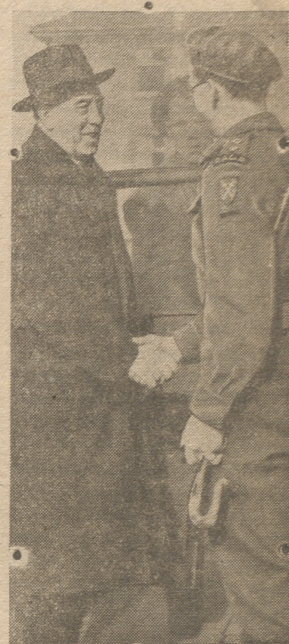
El Obispo de Londres ha hecho una visita a la zona británica de ocupación en Alemania, durante la cual visitó muchos regimientos ingleses. En la foto, grafiá vemos al Obispo de Londres, doctor Wand, saludando a un Padre de un regimiento de Transmisiones

Se acordó elevar el parecer de los harineros a las autoridades competentes para armonizar la producción.