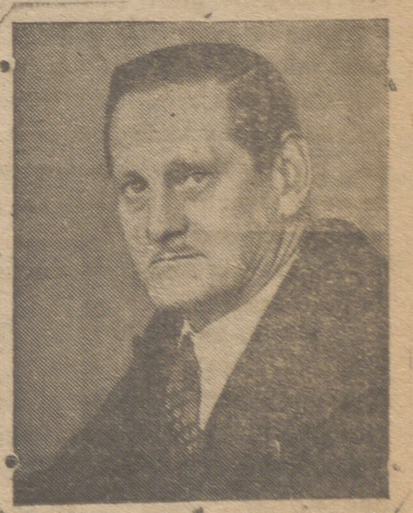
El muy honorable Frederick John Bellenger, ministro de la Guerra británico. Sirvió en Francia en la segunda guerra mundial y fué uno de los muchos oficiales evacuados a las playas de Dunquerque.