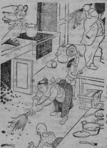
EN ESTA COCINA NO REPARA LA PAZ, HASTA QUE SE DECIDAN A ENDEJAR LOS BOLSOS CRUZ VERDE SIN INFANTILES

PATRONO No olvides consignar el número de días trabajados por los obreros a tu cargo en las declaraciones de Subsidios Familiares que mensualmente presentas en la Delegación del Instituto Nacional de Previsión.