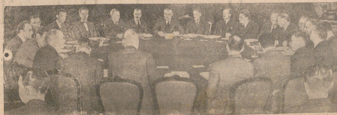
Los ministros de Asuntos Exteriores de las Naciones Unidas celebrando las conferencias de París.

que presenció el acto estuvo correctísimo y aplaudió como se merecía al equipo forastero, quien se mostraba muy satisfecho por la actitud de los espectadores. Por la noche en el Ritz fueron obsequiados los irlandeses con un banquete al que asistieron los directivos de la Delegación Nacional de Deportes Española y muchas personalidades. Al final del mismo, habló el Presidente de la Federación Irlandesa congratulándose de la calurosa acogida que les había mostrado el pueblo de Madrid así como de la presencia del Jefe del Estado en el encuentro. Manifestó que en el partido de vuelta que se ha de celebrar en Dublín se pondrá de relieve la cariñosa amistad de su pueblo hacia el nuestro que tantos puntos de contacto tienen en su vivir. Con entusiasmas vivas a Irlanda y España y a sus Jefes de Estado terminó este acto celebrado en honor de los irlandeses.