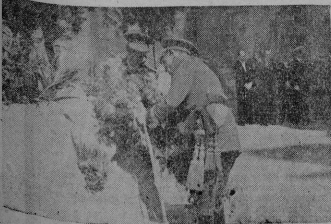
Los Excmos. Sres. Capitán General y Gobernador Militar colocan la primera corona ante la Cruz de los Caídos