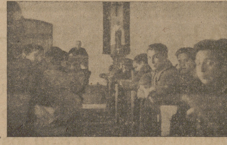
Su selecto cuadro de profesores, dirigido por un sacerdote, es garantía de la enseñanza que reciben.

PORQUE: Contando con amplios patios y campos de deportes, es segura la fuerte constitución del colegial. PORQUE: Poseyendo Laboratorios propios, las enseñanzas son eminentemente prácticas. PORQUE: Todas las actividades del alumno se hallan constantemente vigiladas por sacerdotes que rectifican sus defectos para conseguir un perfecto intelectual cristiano; y PORQUE: En la primera estadística quinquenal del Ministerio de Educación Nacional le ha correspondido el 73'70 por 100 de alumnos aprobados en el Examen de Estado.