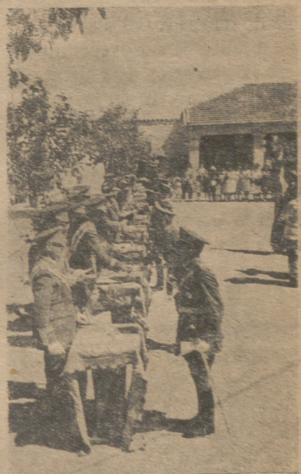
En la Academia de Transformación de Villaverde (Madrid) se ha verificado la entrega de Despachos con motivo del final de los cursillos. Este es un momento de tal acto, en el instante de entregarse tales Despachos a los interesados