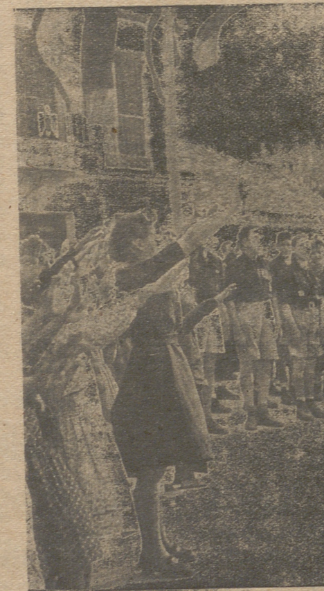
Paralela a la constitución de las Hermandades sindicales realiza una intensa labor el Frente de Juventudes con la inauguración de sus Hogares Rurales.

Todo se halla preparado para una nueva etapa sindical del campo abulense en la que deseamos entre nuestros labradores y ganaderos con plena confianza y satisfacción por el éxito de haber coronado la otra de organización sindical en la esfera social, para luchar ahora por la justicia y el bienestar de quienes trabajan. Hoy señala el jefe provincial del Movimiento en este mismo número de nuestro periódico que «Ningún productor debe sentirse desamparado, todos deben saber que pertenecen a una entidad que al representarles debe recoger sus anhelos y sus afanes». Con esa confianza y esa satisfacción de que hemos hablado deben, pues, disponerse a la realización de su tarea social y económica en servicio a la Patria por enorme que pueda parecer.