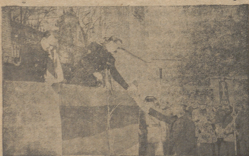
Cabe los históricos muros de la parroquia de San Nicolás en Madrigal de las Altas Torres la entrega de credenciales a los mandos sindicales adquiere características de evocaciones emotivas.

Aquellos agricultores de esta capital que no hayan retirado el Nitrato de Chile que les fué concedido por esta Hermandad, deberán apresurarse a hacerlo en un plazo de cuarenta y ocho horas a partir de la inserción de la presente nota, ya que de lo contrario transcurrido aquel plazo se considerarán como anulados los vales no retirados.