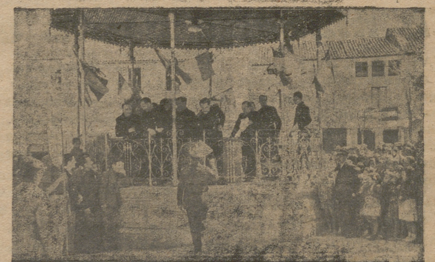
Entusiasmo patriótico y popular en el acto sindical celebrado en hermoso marco de la plaza arevalense.

Ningún productor debe sentirse desamparado. Todos deben saber que pertenecen a una Entidad que al representarles debe recoger sus anhelos y sus afanes: La Hermandad Sindical.