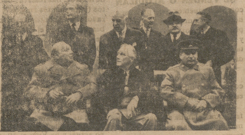
Reunión de Teherán

ria una misión delicada en Vichy, según después pudo saberse. Leahy estableció contacto con el almirante Darlan y pronto el desembarco de los Estados Unidos en Dakar, Mesalquivir, Orán y Argel presentó al mundo la realidad de una sabia política perfectamente dirigida. La intervención de los Estados Unidos en la gue-