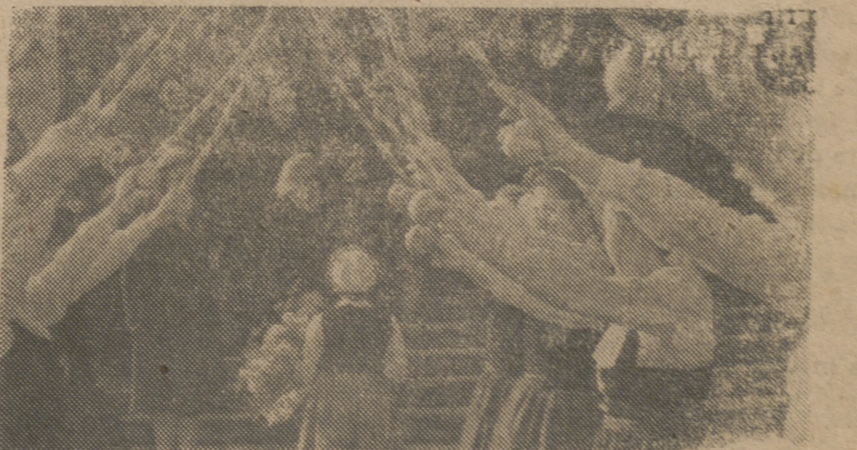
Un aspecto de los actos folklóricos realizados en San Sebastián con motivo de la clausura del Consejo Nacional de la Sección Femenina.