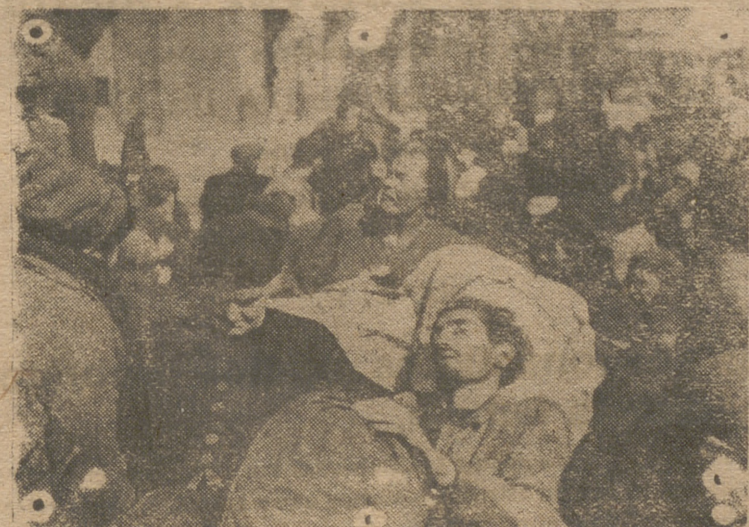
Después de haber sido sofocado el levantamiento comunista por las tropas alemanas, salen los ciudadanos de los sótanos donde estuvieron encerrados mientras duraron las luchas. En sus caras de sufrimiento y hambre se reflejan los horrores pasados durante los trágicos días. —(Foto «Presamundo»).