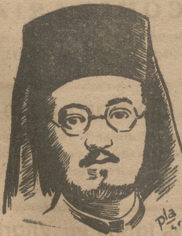
Damaskinos, Regente de Grecia y Arzobispo ortodoxo de Atenas