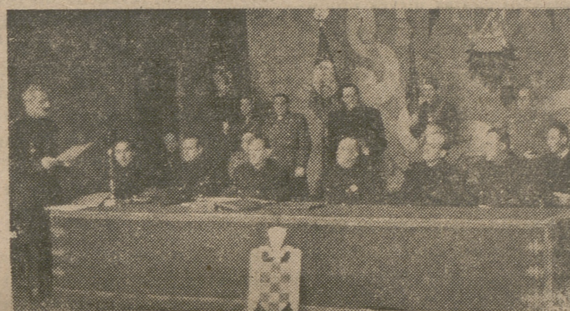
El Caudillo durante el discurso de clausura del IV Consejo Nacional del Frente de Juventudes.