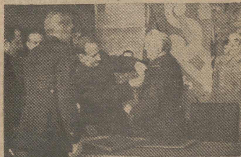
En el acto de clausura del IV Consejo Nacional del Frente de Juventudes el ministro secretario general del Movimiento, impone al Caudillo la nueva insignia en oro que distinguirá a los nuevos camaradas del Frente de Juventudes.