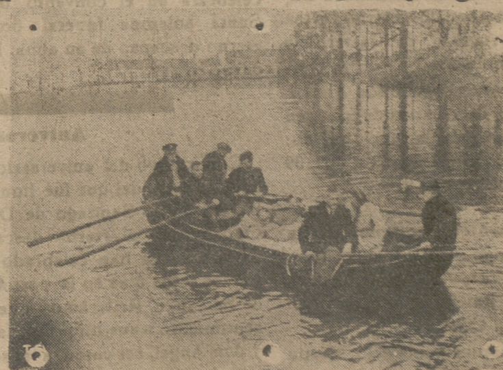
La isla de Walcheren ha sido inundada por la acción de las bombas angloamericanas. Por ello la población civil ha quedado en gran parte sin hogar y con lo poco que puedan salvar se trasladan a otros lugares.