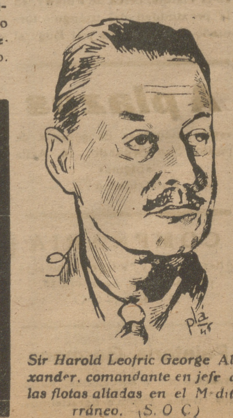
Sir Harold Leofric George Alexander, comandante en jefe de las flotas aliadas en el Mediterráneo.