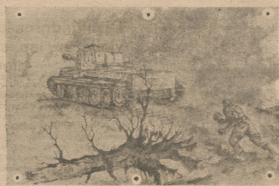
Un zapador alemán se dispone a inutilizar un tanque enemigo. Dibujo de un corresponsal de guerra alemán.

En el flanco septentrional del saliente de las Ardenas, la resistencia enemiga ha aumentado al sur de Stavelot y Halmédy. Las fuerzas aliadas han tomado el pueblo de Henumont Herdome, y Thirimont. En dirección suroeste hemos limpiado Mont Le Ban y cortado la principal carretera Houffalize Chéram, al sur de Chéram. En el sector al oeste de la carretera Laroche Bertogne continuaron las operaciones de limpieza, y unidades de reconocimiento llegaron hasta el río Ourthe, donde establecieron contacto con patrullas aliadas procedentes del flanco meridional del saliente. Al noroeste de Bastogne, unidades aliadas avanzaron contra una resistencia considerada, con