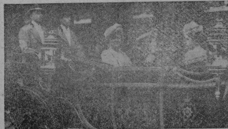
El Rey Jorge V y la Reina con las princesas se dirigen para presenciar el desfile de la Victoria a Trafalgar Square, en medio del entusiasmo de las multitudes que acogían el paso de la familia imperial inglesa, con vivas muestras de entusiasmo y cariño.