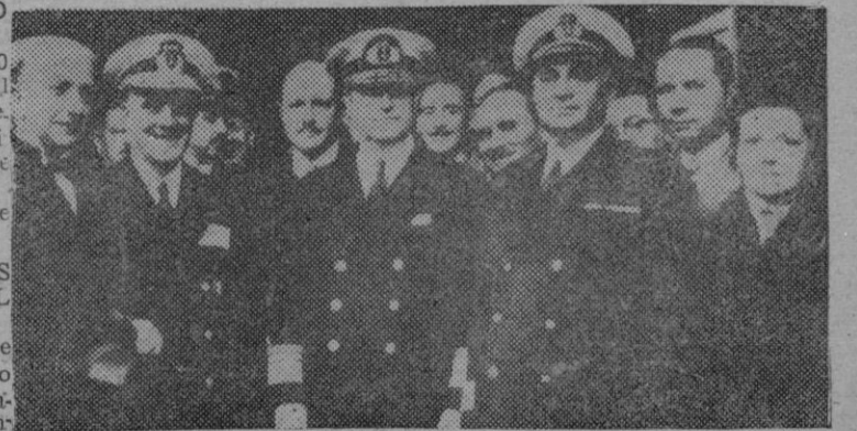
Como Ministro plenipotenciario y enviado extraordinario de España para el acto de la toma de posesión del Presidente Perón, el Almirante Moreno, que llegó a la capital argentina en el crucero "Galicia", fué recibido en los muelles del Plata por el Embajador de España, Conde de Bulnes, y el Ministro de Marina argentino contralmirante Pantin.