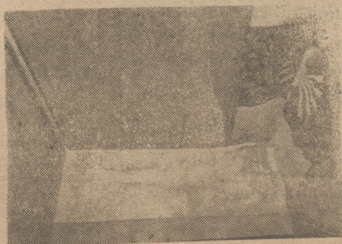
La recia musculatura del Fundador dejó impresa su huella en ese pedazo de tierra levantina que refleja la foto y que ha sido cuidadosamente recogida como una reliquia.—(S. O. F.)