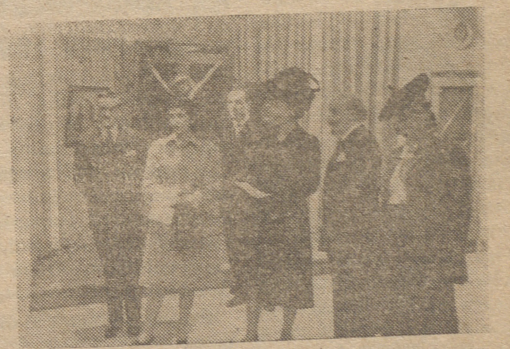
La esposa y la hija del Caudillo recorren la Exposición de pintura de los hermanos Borrell en Madrid.