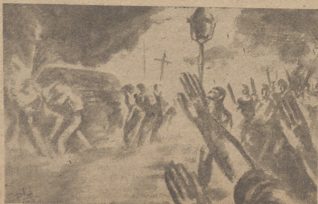
Entre un bosque silencioso de manos extendidas arropado en el manto de la noche española, el cortejo mortuario de los restos del Fundador avanza sobre los nervudos hombros de sus mejores camaradas.—(S. O. C.)