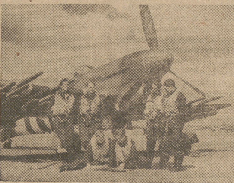
Los pilotos de una escuadrilla inglesa, descansan un rato mientras reciben nuevas órdenes.

NUEVA YORK, 7.—Los primeros informes que llegan acerca del desarrollo de las elecciones presidenciales señalan un equilibrio de votos, aunque es demasiado pronto para formular una opinión sobre quién resultará vencedor. Se espera que dentro de unas cuantas horas esté definido el resultado.