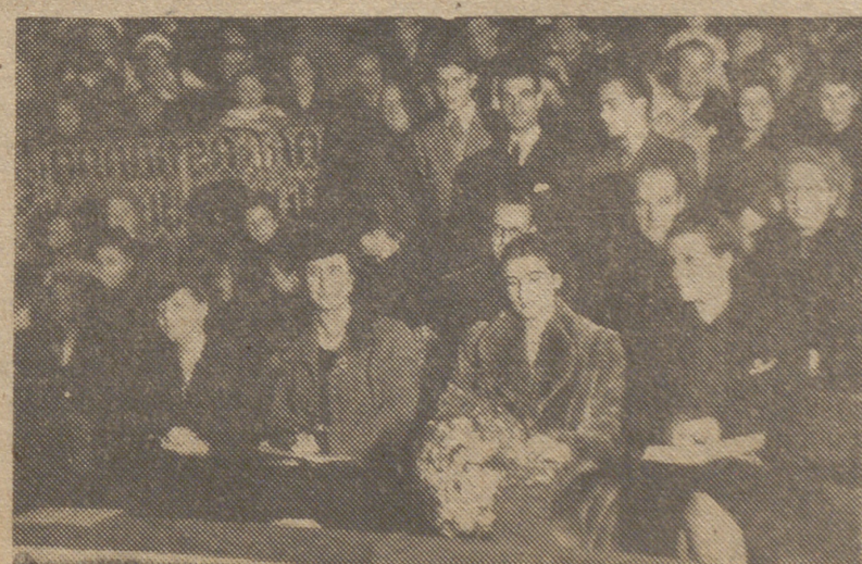
La esposa e hija del Generalísimo acompañadas de diversas personalidades y jeraquías asisten a la función infantil celebrada en el Circo Price con motivo del VIII aniversario de la fundación de Auxilio Social.

Nuestro señor Obispo así dijo: Ehorabuena todos. Siento gran satisfacción por este paso firmísimo que habéis dado para vuestro bien. Esta obra es de gran transcendencia, no sólo en el orden material, ya que supone la manutención diaria de tantos niños, sino en el orden espiritual. Una advertencia saludable. De nada servirá esta espléndida obra de caridad y justicia social si los señores maestros no sienten junto a