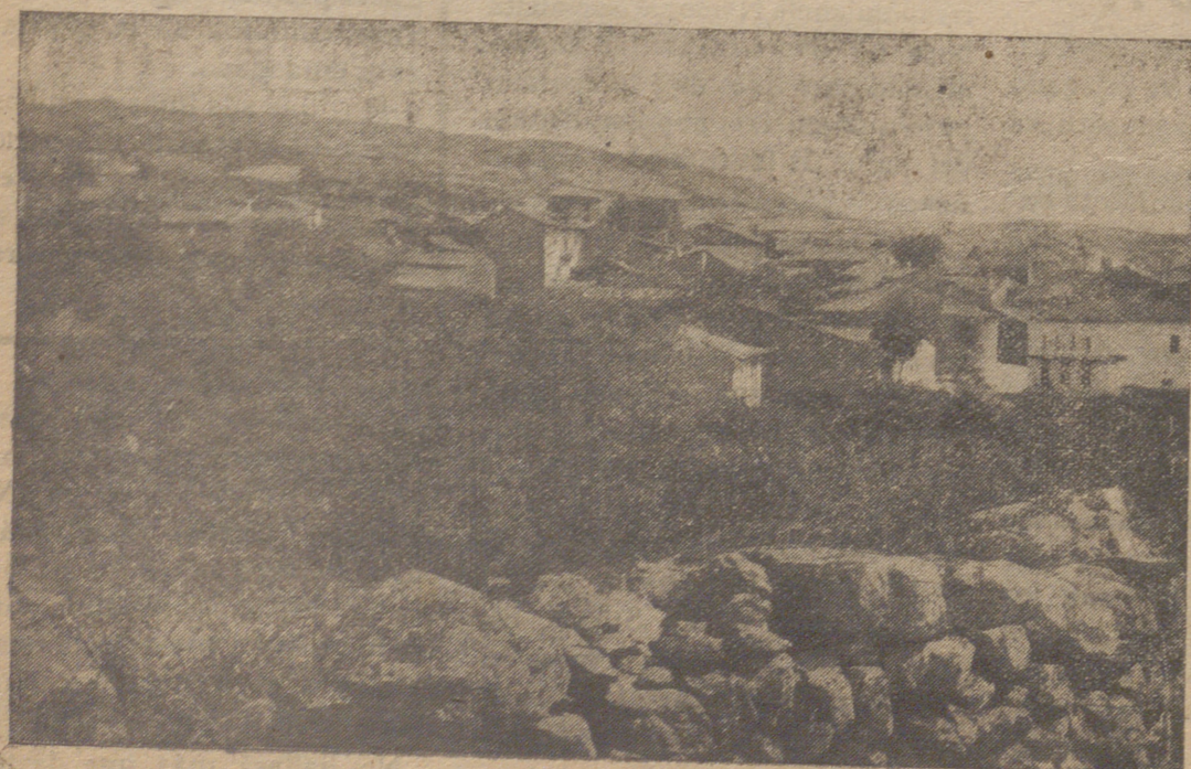
Escarabajosa, pueblo natal de don Regino Rodríguez.