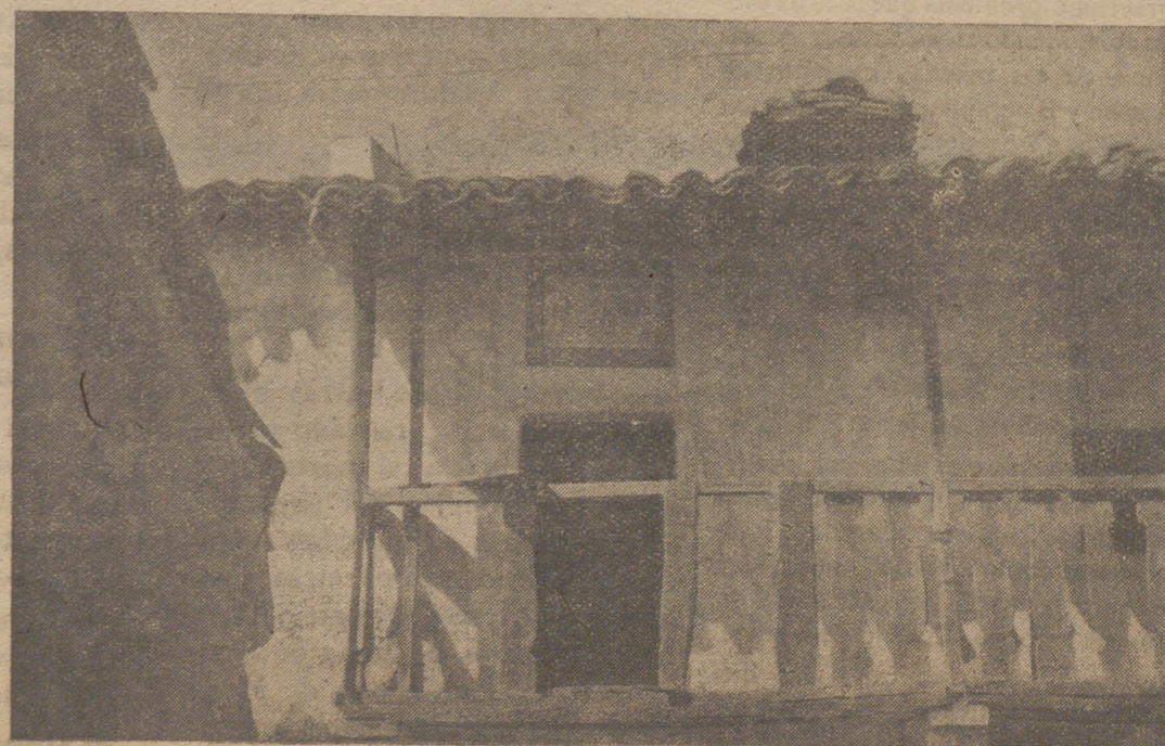
Casa donde nació el señor Rodríguez Barderas.