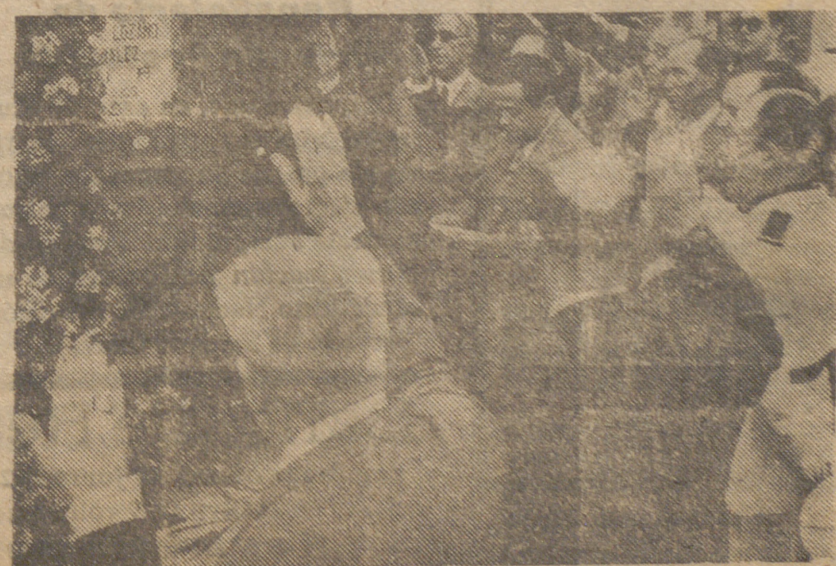
Presidencia que asistió al acto en el Día del Periodista Caído.—(Foto S. O. F.)

MADRID.—Con asistencia de autoridades, jerarquías y numeroso público ha tenido lugar el acto conmemorativo del aniversario de la muerte gloriosa de numerosos periodistas caídos por Dios y por España durante la dominación roja en Madrid.—(Cifra)