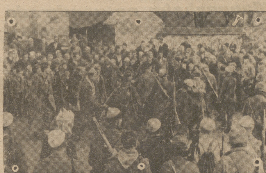
En una pequeña población servia las gentes, agradecen la liberación por los soldados alemanes y los voluntarios musulmanes. Con este motivo se organiza un baile típico. (Foto «Presamundo»).