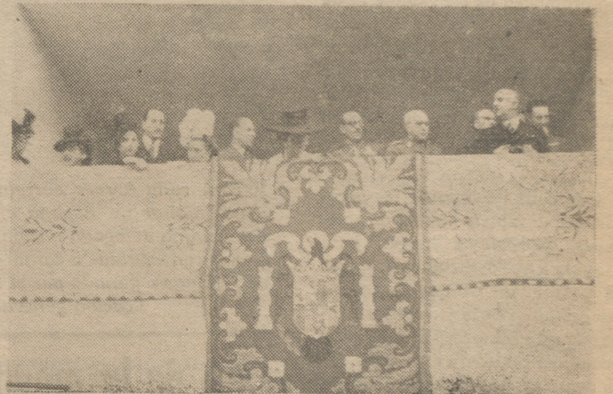
«El Caudillo asistió a las carreras de caballos en el Hipódromo de la Zarzuela donde se corrió el premio de S. E. el Generalísimo.»

BUENOS AIRES, 29.—Los diarios argentinos dedican amplias informaciones a la Exposición del Libro en Madrid, y destacan que es la más importante de cuantas se han realizado con carácter popular.—EFE.