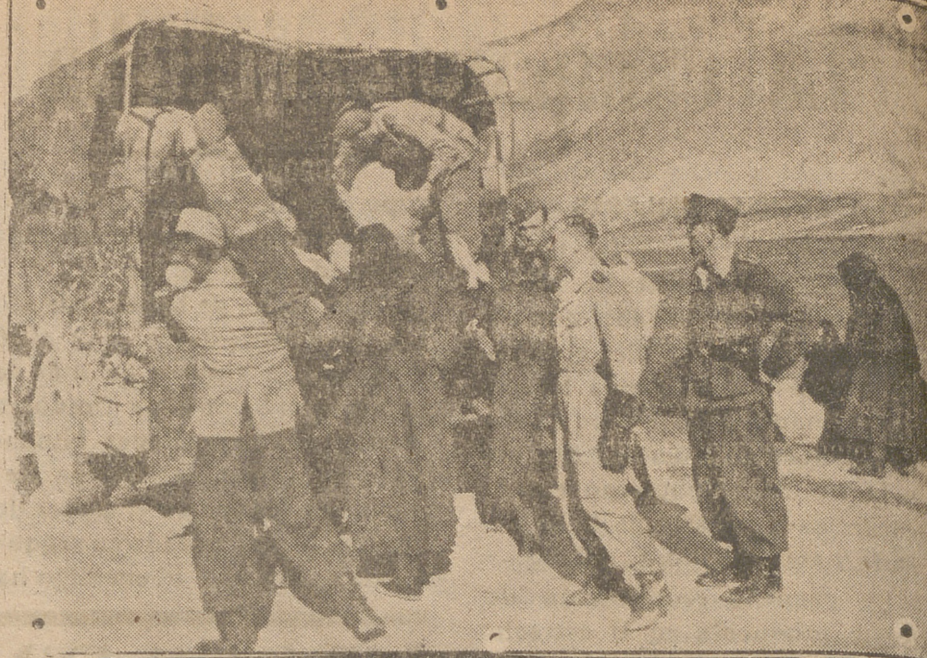
Los soldados alemanes ayudan a la población italiana que quiere quedarse para ser «liberados» por los angloamericanos. A la petición: — ¡Lleárnos con vosotros!, los soldados alemanes responden pudiendo el camión a su servicio. — (Foto «Presamundo»).