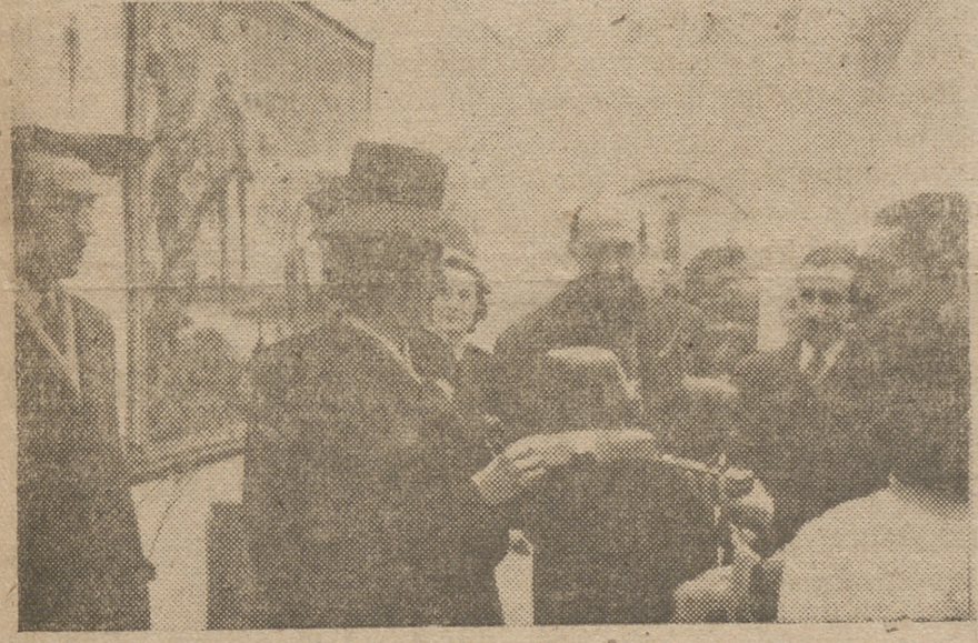
La esposa del Caudillo acompañada de otras jerarquías visita la Exposición de Alfombras y Tapices en el Mercado de Artesanía.

Si los barcos no intervienen, entonces con toda seguridad —conociendo el espíritu militar del germano y la gran «cabeza» que le dirige— va a ser un hecho el luctuoso suceso que apunta Argel y que pudiera traer consecuencias muy grandes en orden a la futura invasión de la Europa del Oeste por parte de los aliados.