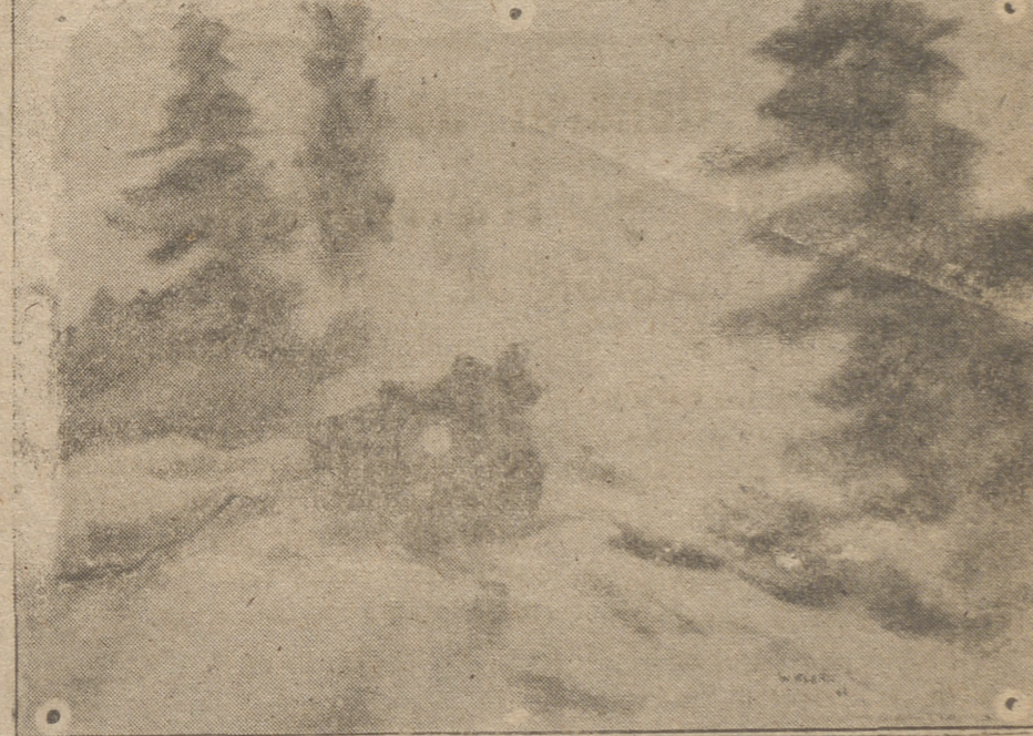
Un entace alemán salva una altura en una carretera de Montaña del frente italiano.

Todos los periódicos turcos dicen que su nación no admite más que una guerra defensiva. Y el diario «Achan» lanza a los ingleses esta «pildorita»: Turquía tiene muy presente lo ocurrido en las islas del Mar Egeo que el Reich ocupó después de la defección de Ba-