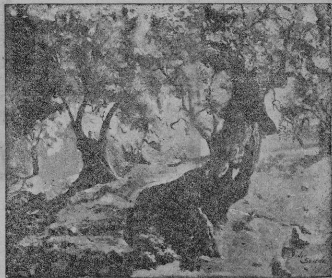
Olivos de Valdemosa, óleo de Pedro Sureda

"Les albes clares i les nits d'estrelles i el florir de roses".