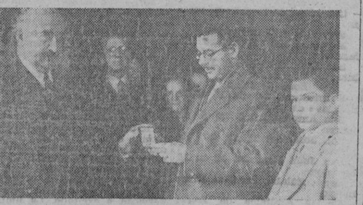
El campeón nacional de Ajedrez Antonio Medina, recibe de manos del Alcalde de Madrid, la Medalla de Oro del Deporte en homenaje a su actuación en el torneo celebrado recientemente en Londres. Asiste al acto Arturito Pomar.