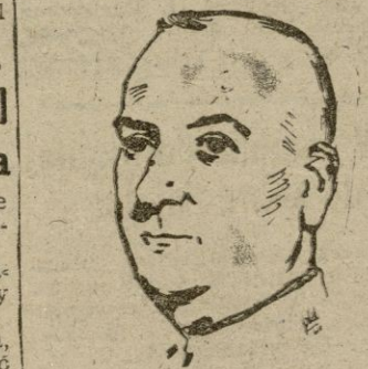
EL MINISTRO DE OBRAS PUBLICAS

Tenerife. — El Ministro de Obras Públicas, señor Fernández Ladreda, ha visitado el puerto de la capital acompañada del Director General de Puertos y Señales Marítimas.