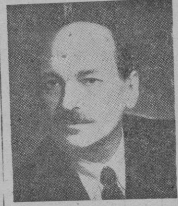
MR. CLEMENT ATLEE

Abordó a continuación la cuestión comercial y dijo que hasta ahora la actuación de Sir Stafford Cripps, al frente de la Jun-