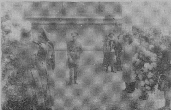
La solemne ofrenda de coronas celebrada en la mañana de ayer en la Plaza de la Seo