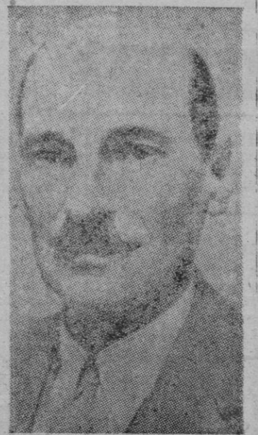
Mr. Clement Atlee

Añade que las discusiones con Truman relativas a la bomba atómica se iniciarán el domingo a bordo de yate presidencial, en el río Potomac.