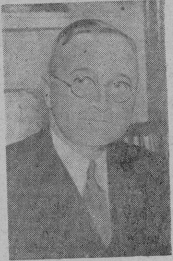
El Presidente Truman

Washington. — Igual que el martes y el miércoles, ayer el