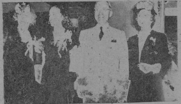
El Presidente Truman de los Estados Unidos, acompañado de su familia—su hija, su esposa y su hermana—, que habitan actualmente en la Casa Blanca, residencia que antes ocupara el Presidente Roosevelt, su antecesor