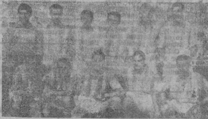
El equipo del Córdoba que, en cabeza de la clasificación, se presentará el domingo a nuestro público, en el esperado partido contra el Mallorca.

sado con el entrenador Patricio de la Rovira. Acaso se haya hablado de ello demasiado.