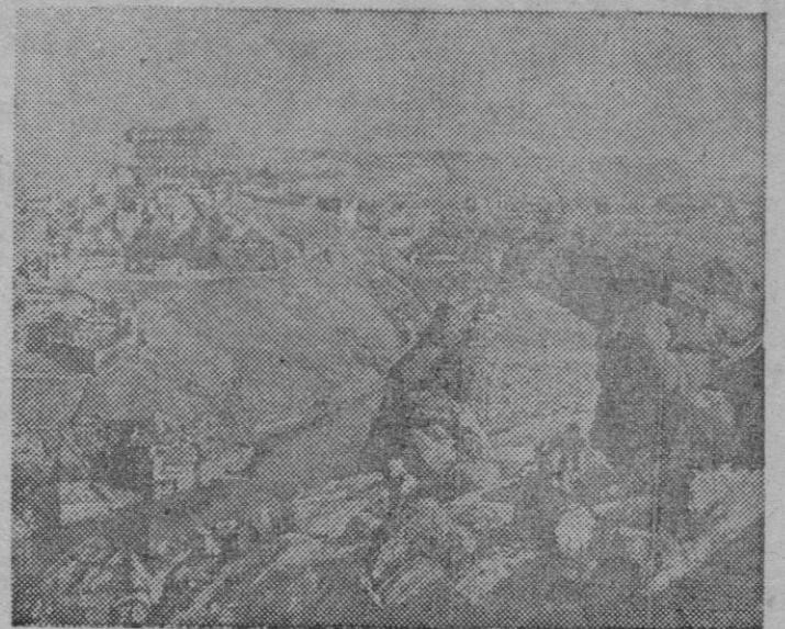
Cuadro que fué premiado en la última Exposición Nacional de Bellas Artes con la medalla de oro; Ministro del Ejército, obra del pintor toledano Enrique ue Vera, quien ha sabido interpretar en este lienzo el magnífico, agreste y duro paisaje de Toledo donde se ve coronado todo, por el antiguo Alcázar toledano. (Foto Scrip).