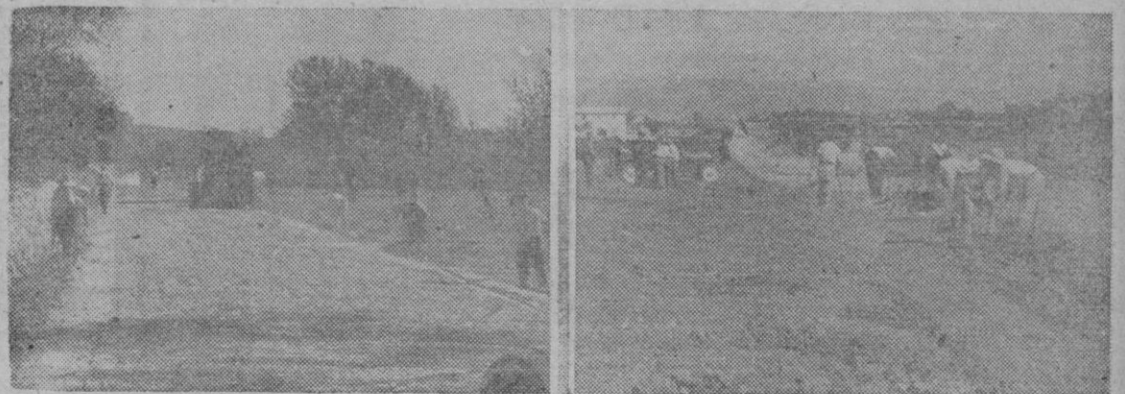
A la izquierda, un aspecto de la carretera de Sineu que es reparada y ensanchada y en la que trabajan activamente un centenar de obreros. A la derecha, un grupo de obreros y una apisonadora trabajando en el nuevo y ancho camino que unirá las carreteras de Manacor y Lluchmayor

Las obras que en plena normalidad hubieran tardado dos o tres años en ser estudiadas, aprobadas y puestas en marcha, lo están ya, y varios miles de obreros, que hubieran quedado sin jornal durante las presentes