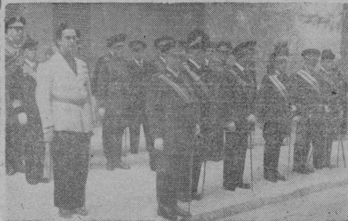
El Excmo. Sr. Capitán General de Baleares, don Salvador Murguía, con las autoridades, presidiendo el desfile de la fuerza que rindió los honores reglamentarios.