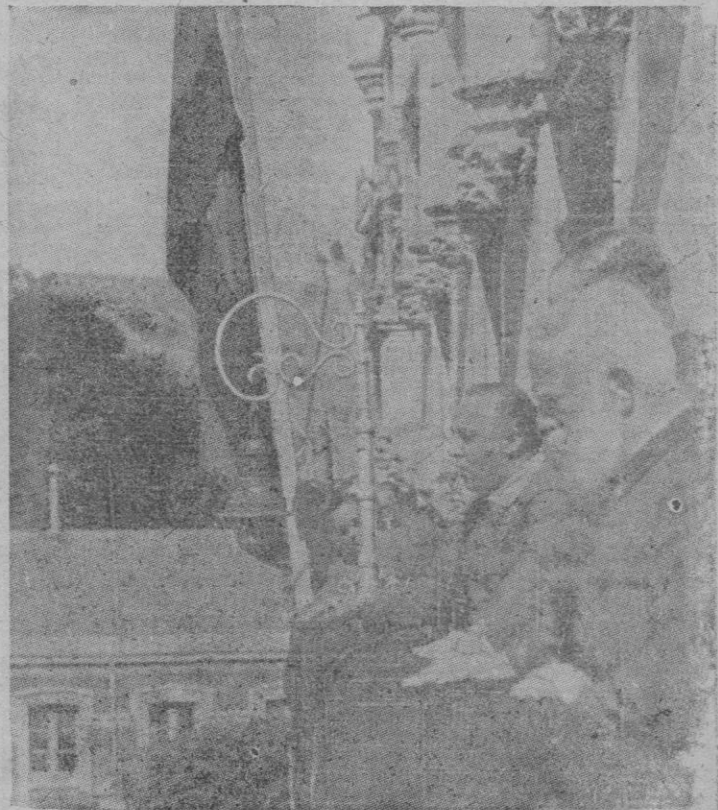
El Generalísimo Franco, rodeado de los miembros de la Junta de Defensa Nacional, dirigiéndose a la multitud, que le aclamaba entusiastamente, desde el balcón de la Capitanía General de Burgos, el día de su exaltación a la Jefatura del Estado Español.

Continúa en la primera columna de la 2.ª página