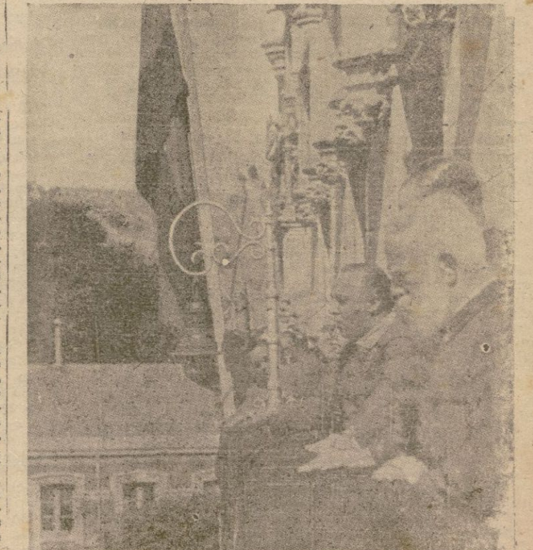
El Generalísimo Franco, rodeado de los miembros de la Junta de Defensa Nacional, dirigiendo se a la multitud, que le aclamaba entusiastamente, desde el balcón de la Capitanía General de Burgos, el día de su exaltación a la Jefatura del Estado Español.