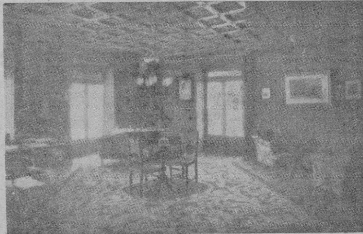
Sala de la Capitanía General de Burgos, donde se constituyó la Junta de Defensa Nacional

una — termina por volver a la superficie de las aspiraciones humanas, aunque momentáneamente, sin excesos minoritarios o por imperativo de las circunstancias, hayan vivido en el eclipse.