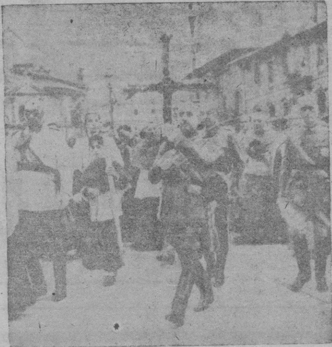
S. E. el Jefe del Estado llega a la Catedral de Oviedo llevando la histórica Cruz de la Victoria

Fiel al sentido de la tradición, y no olvidando que un "gobierno será tanto más excelente cuanto más directamente se dirija al fin último de la sociedad", Franco no sólo se ha interesado por los problemas materiales que en forma acuciante era necesario resolver tras la Cruzada liberadora, sino que reiteradamente, de un modo que no tiene par en los Estados modernos, ha procurado impregnar del sentido católico, tradicional en España, la mayor parte de la legislación y de las costumbres políticas de los últimos años. Y como buen padre de familias, intenta superar las antiguas discordias que pusieron en grave peligro a nuestro pueblo y hace cuanto sabe para lograr la cordial unidad entre todos los españoles. — S. M.