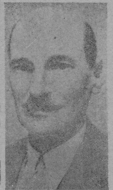
Mr. Clement Attlee

El primer ministro pidió a los obreros que le apoyen, no sólo en el cumplimiento de las tareas necesarias, sino en la «de hacer comprender a la gente que debe tener paciencia». «El trabajo y la paciencia—dijo—fueron los que nos ayudaron durante los meses de espera antes